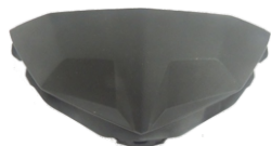
CAPA DO PAINEL - PRETO