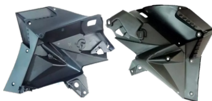
COMPLEMENTO DO PROTETOR DE TANQUE - PAR