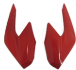
CARENAGEM DO FAROL LATERAL