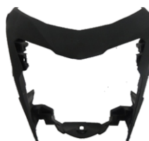
CARENAGEM DO FAROL - PRETO